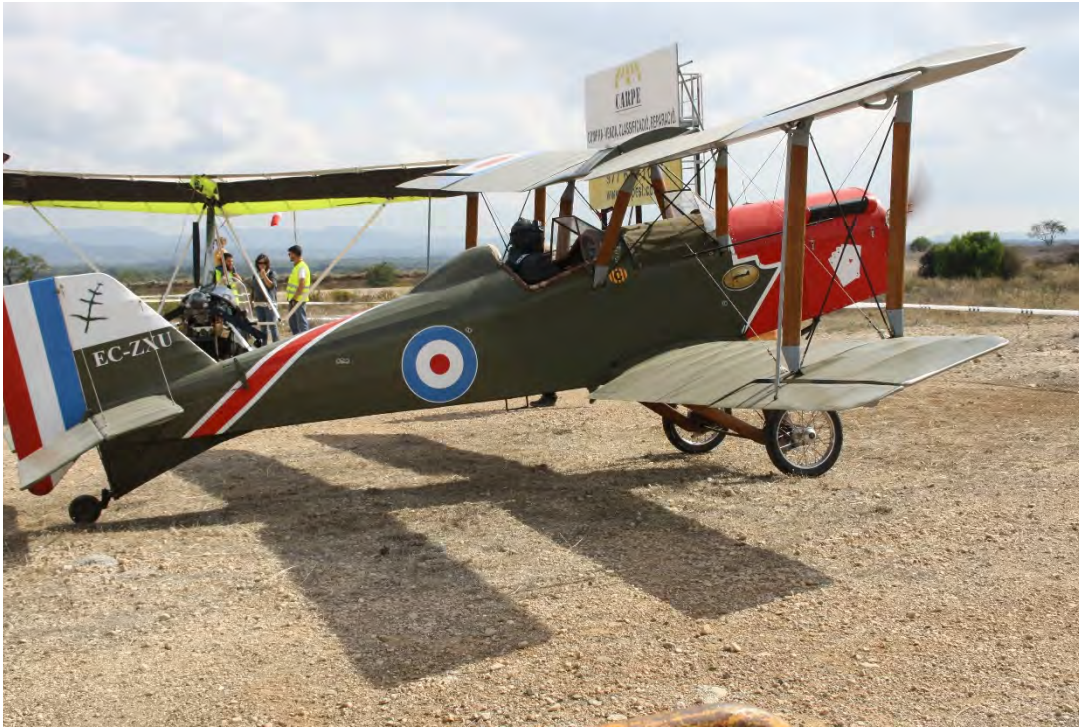
Fira dels Esports de l'Aire