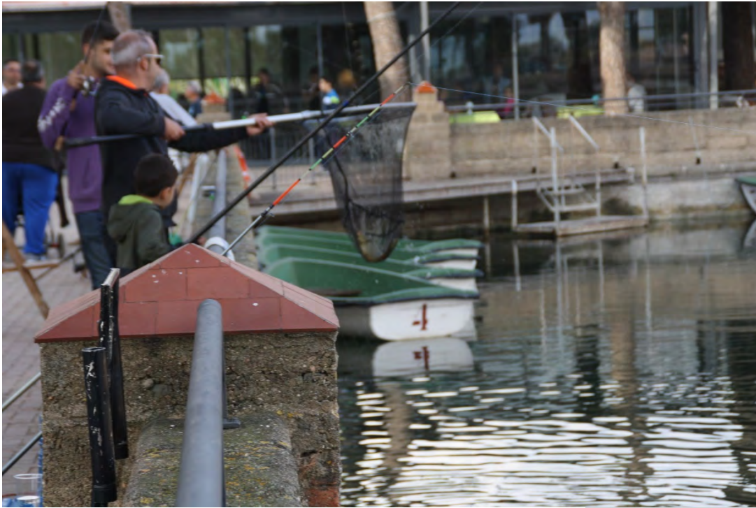
Concurs de pesca a La Bassa