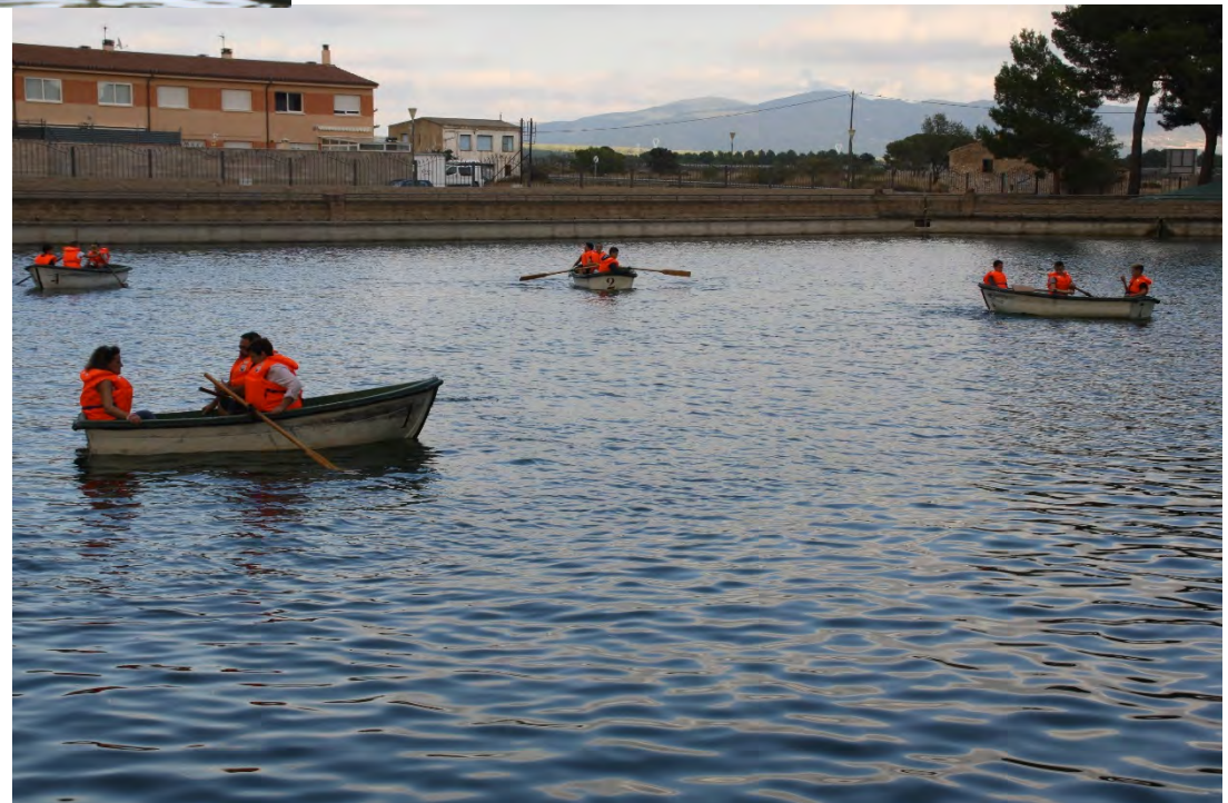
Passejades en barca per La Bassa