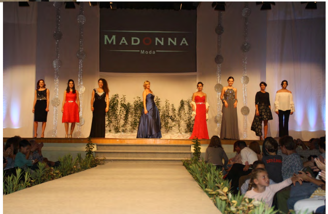
Passarel·la de Moda