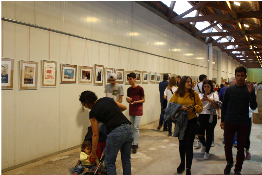
Exposició de fotografia