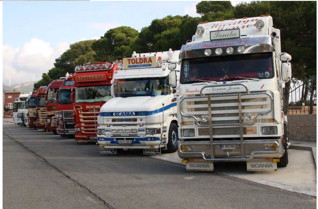
Trobada de camions tunejats