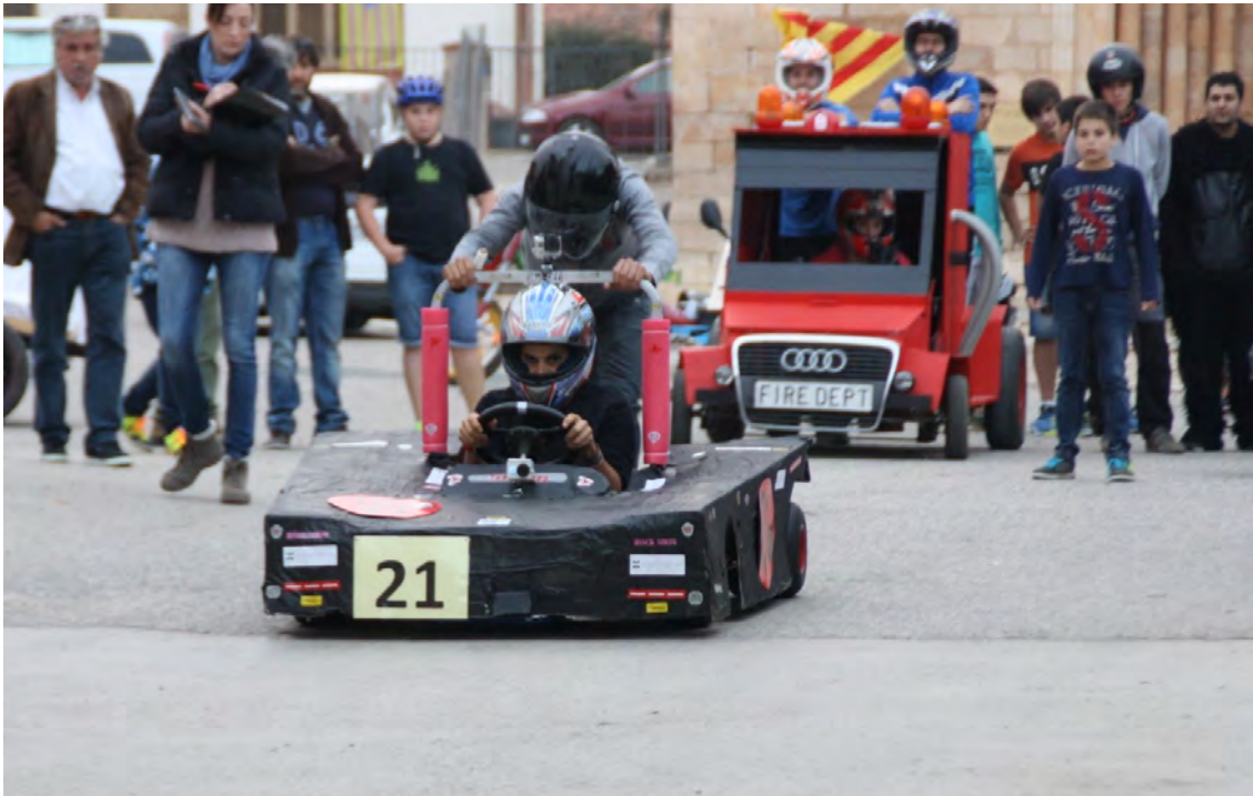
Baixada de Trastos per "La Vila"