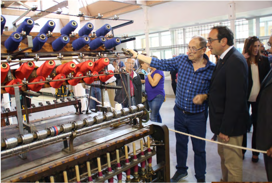
Centre d'Interpretació del Tèxtil