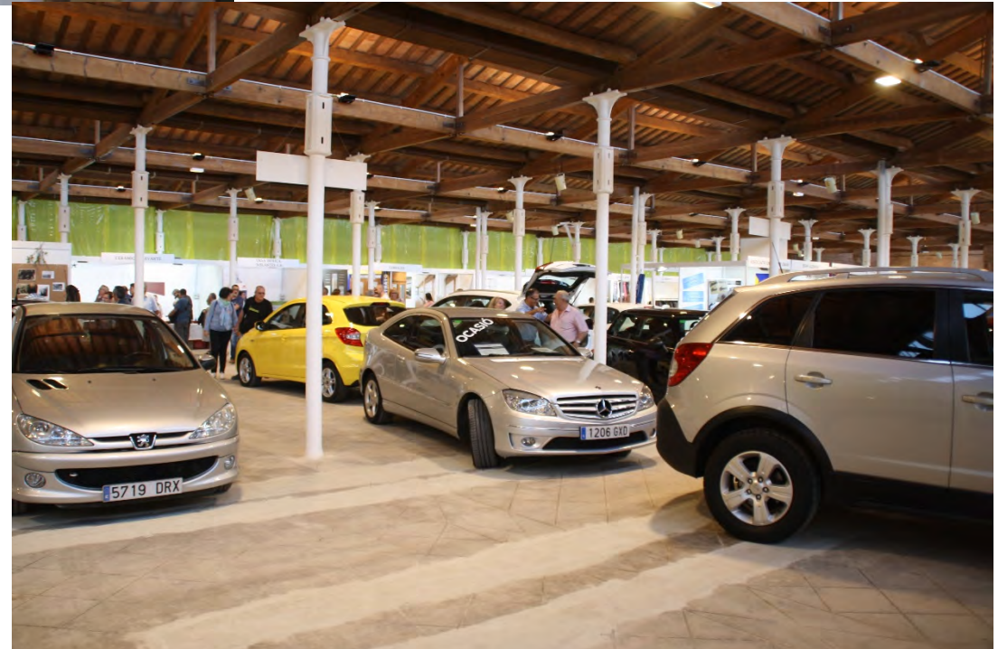
Fira del Vehicle d'Ocasió