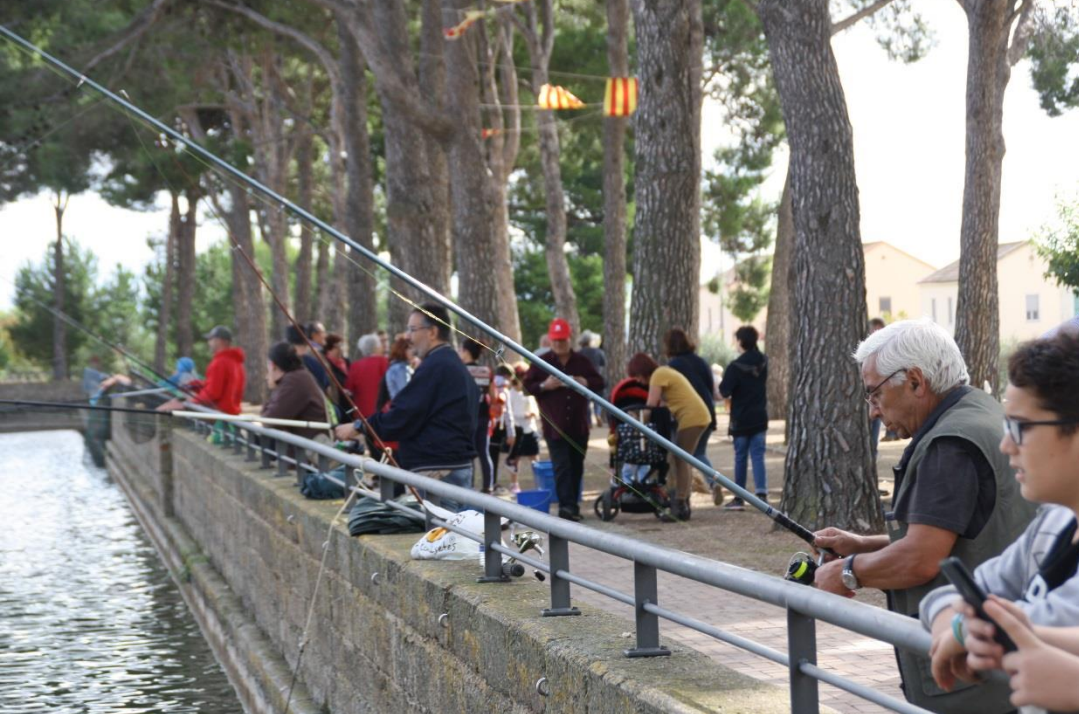
Concurs de pesca a La Bassa