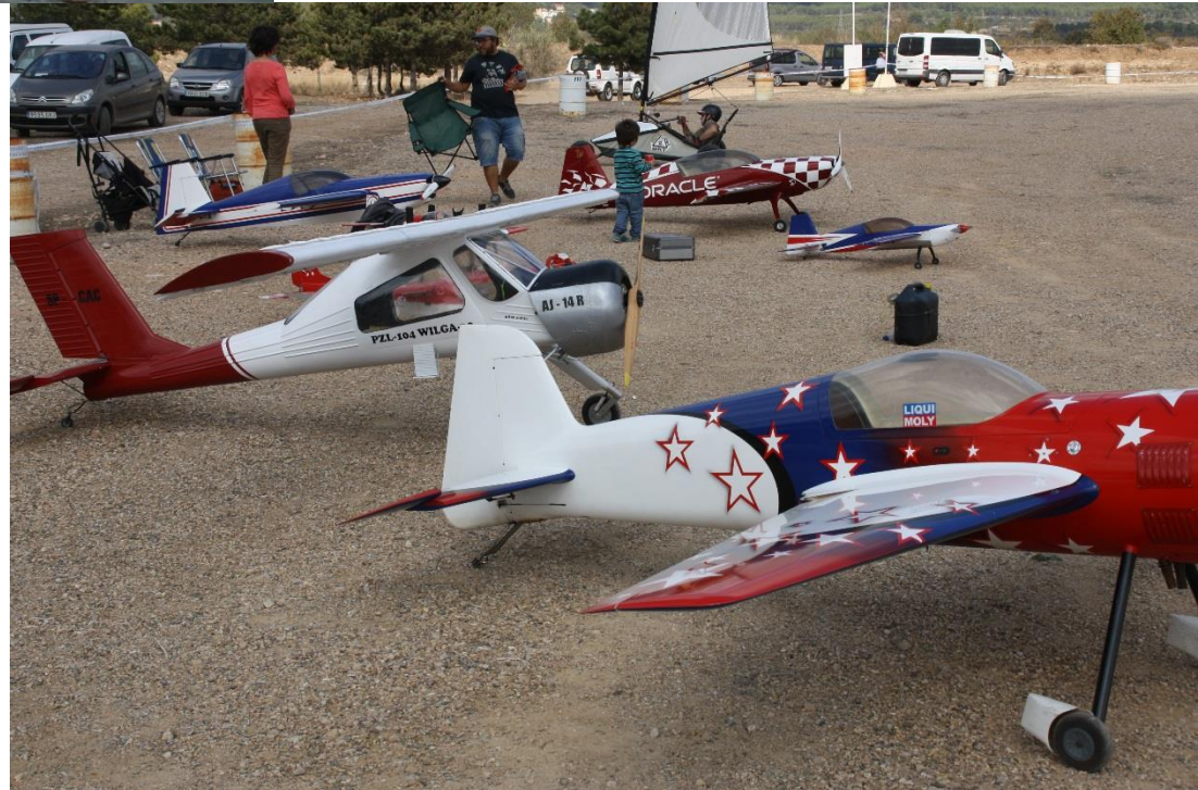
Fira dels Esports de l'Aire