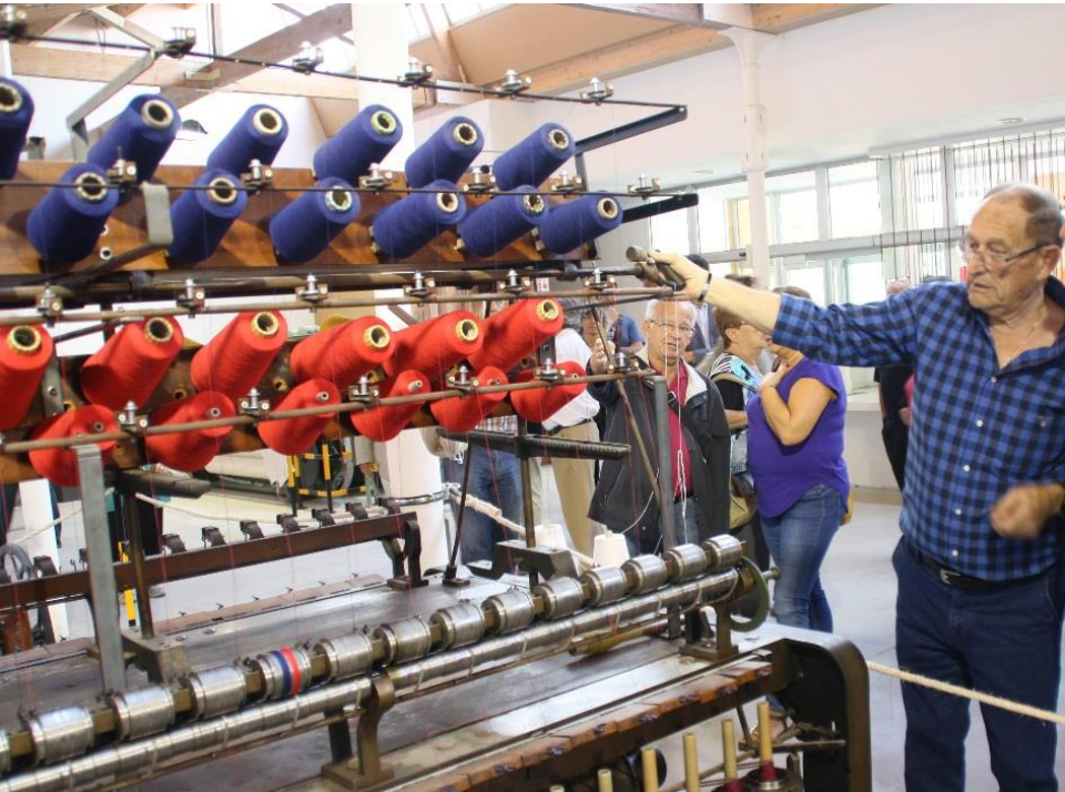
Centre d'Interpretació del Tèxtil