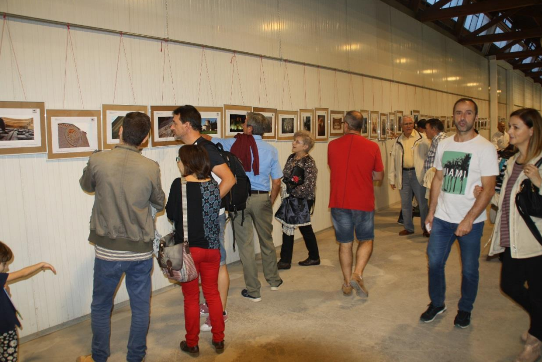
Exposició de fotografia