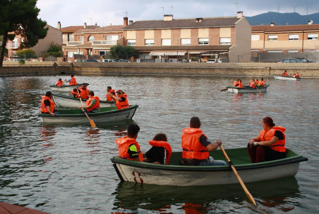
Passejades en barca