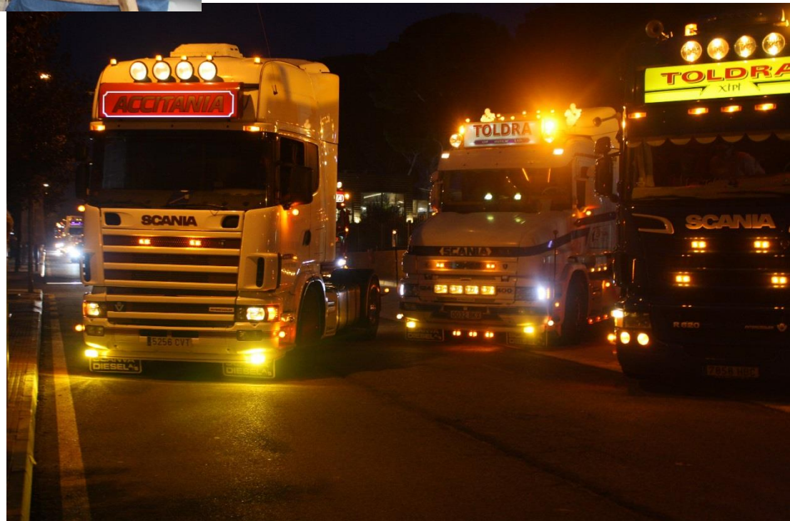
Trobada de camions tunejats