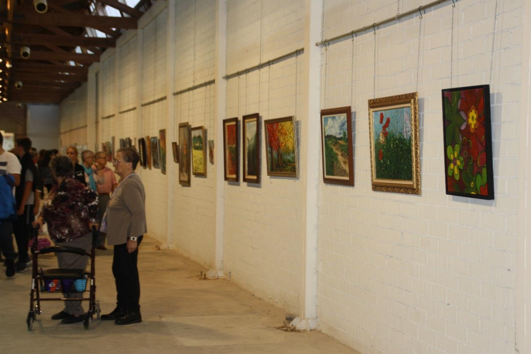
Exposició de pintura