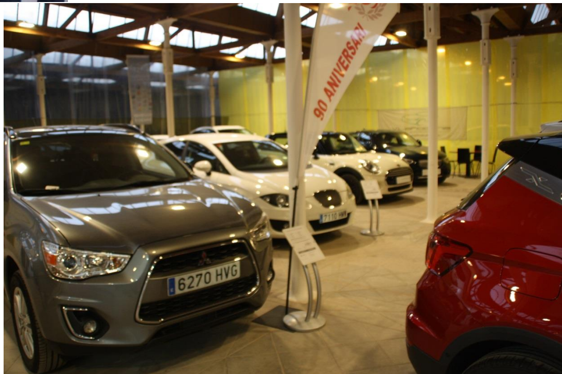
Fira del Vehicle d'Ocasió