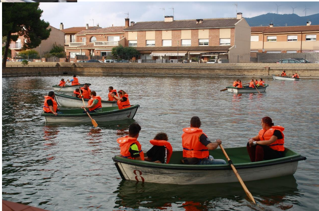
Passejades en barca per La Bassa