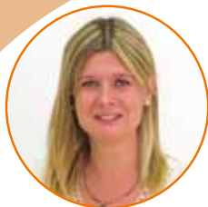
Noemí Llauradó i Sans Presidenta de la Diputació de Tarragona